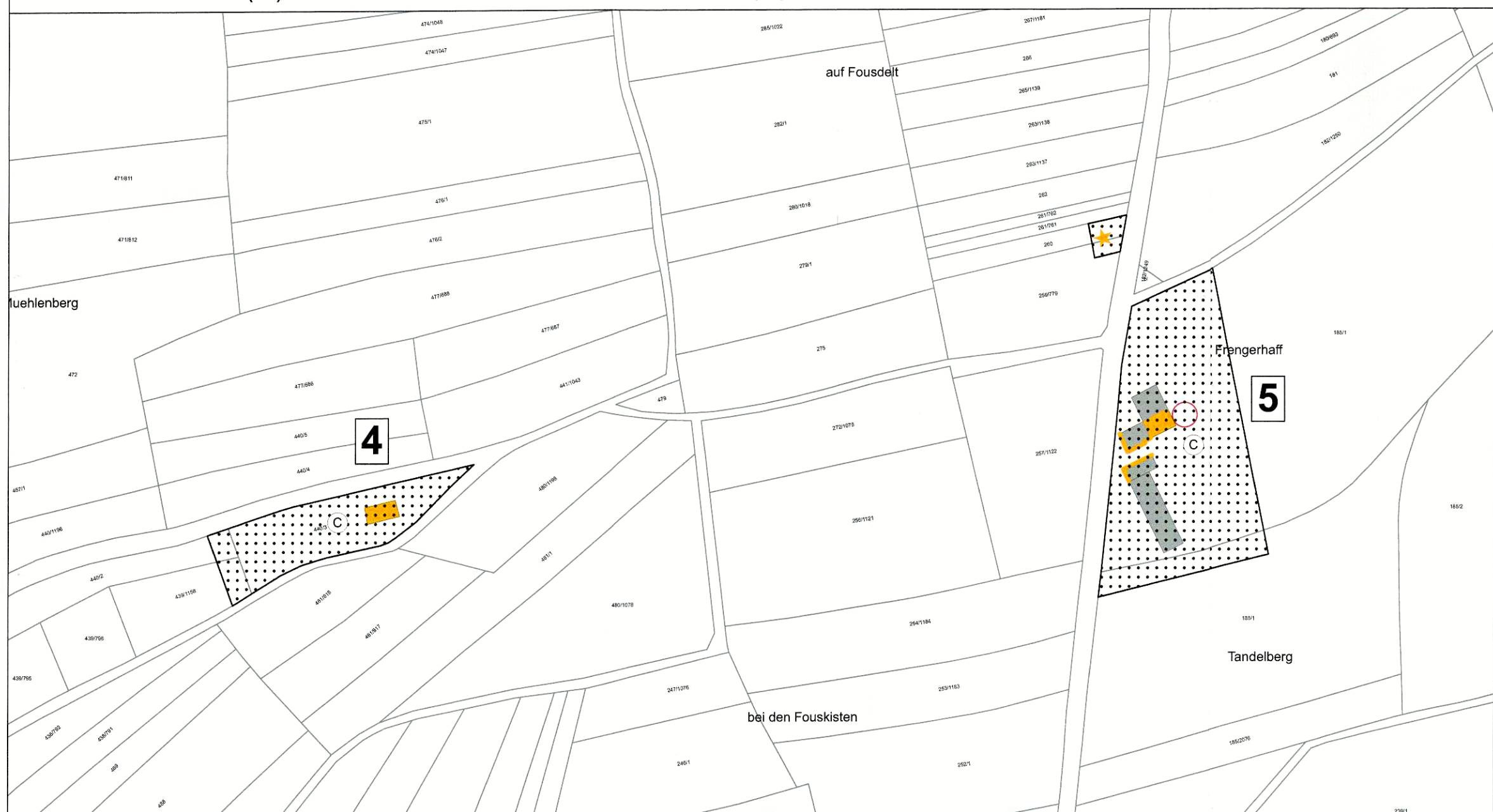
4 - Föschbecherhaff / 5 - Frengerhaff