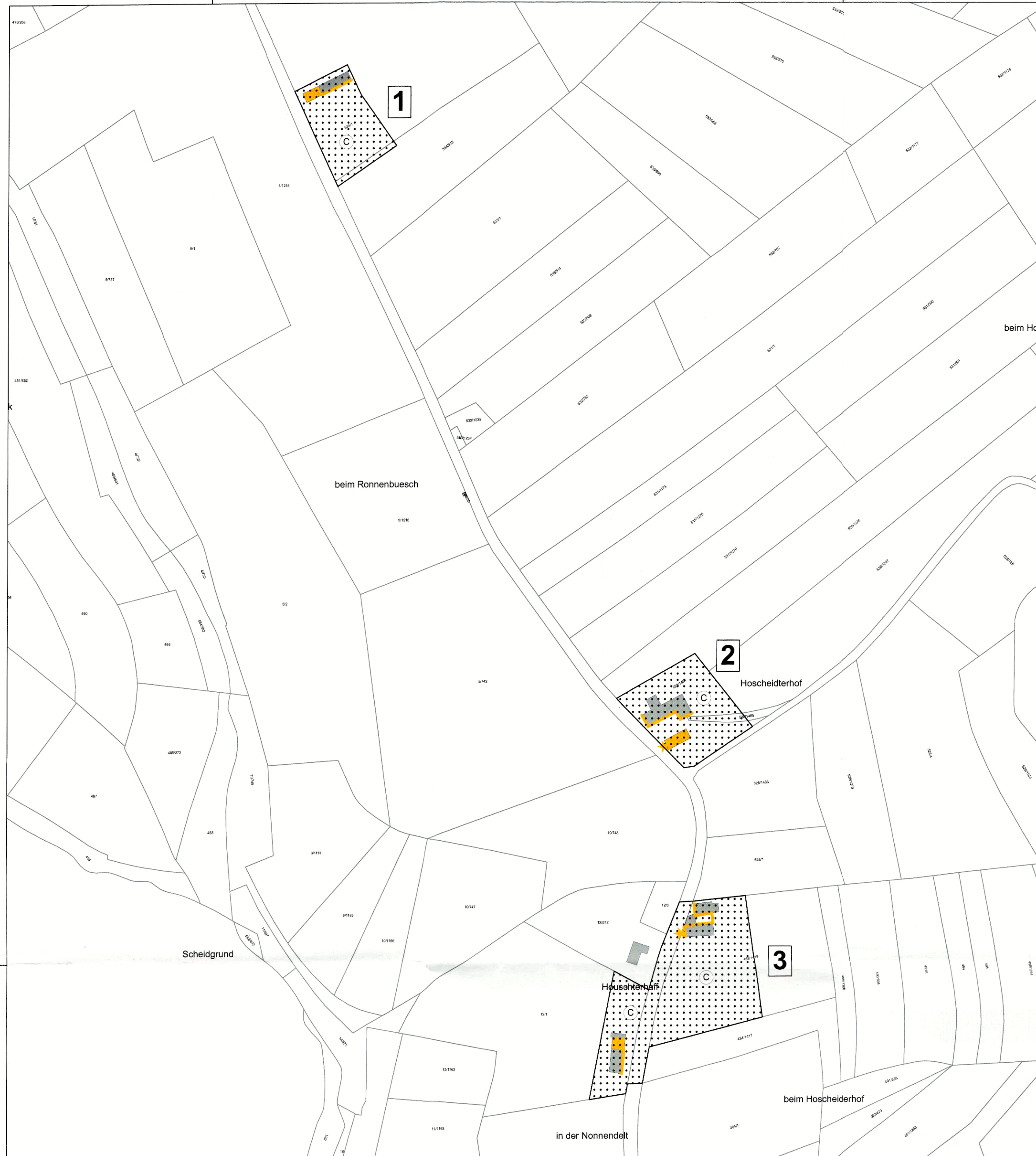
1 - Houschterhaff (P.) / 2 - Hoscheiderhof / 3 - Houschterhaff (T.)