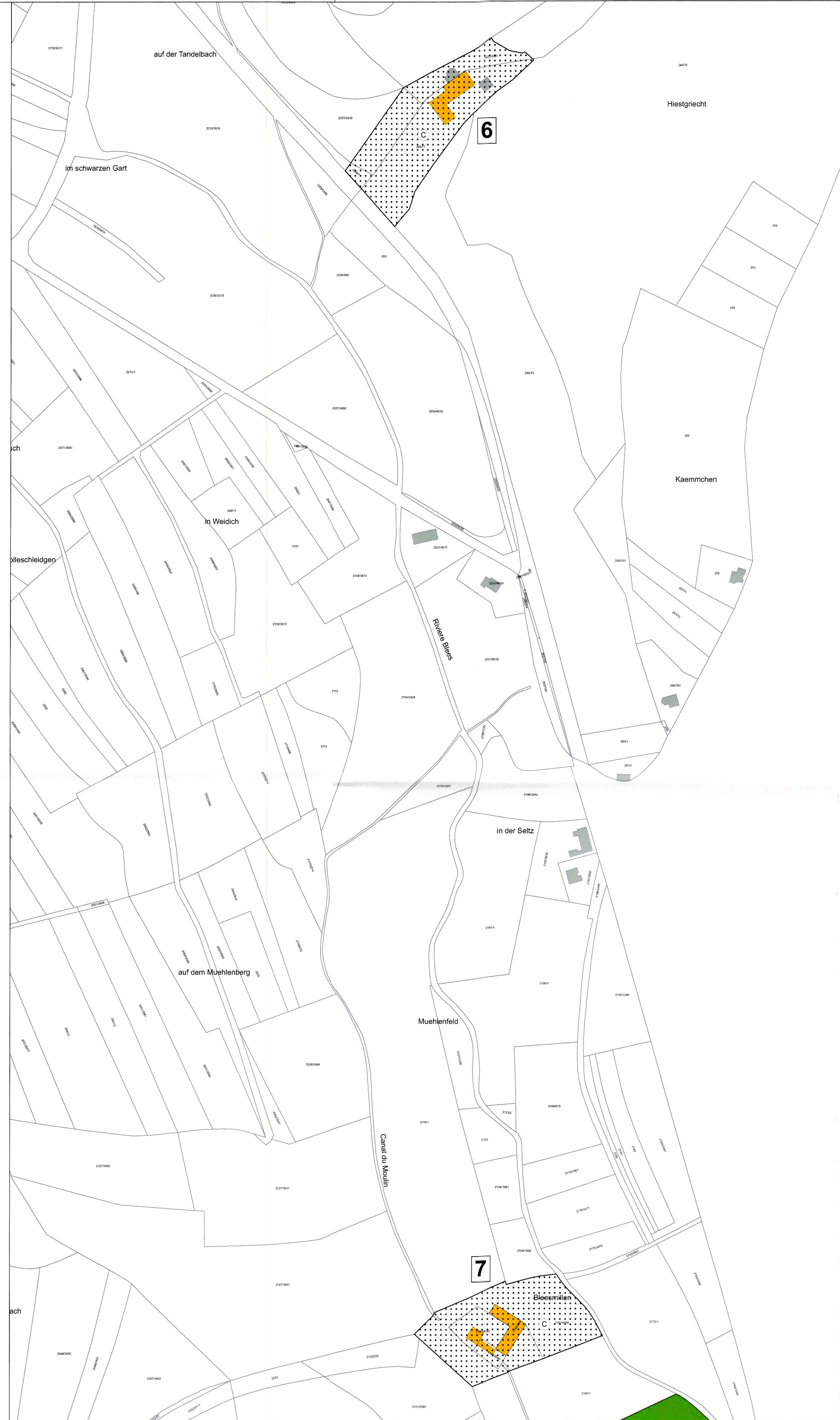
6 - Valeriusshaff / 7 - Bleesmillen