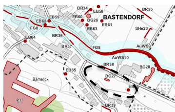
Illustration 3 biotopes à préserver (Efor-Ersa 2010)