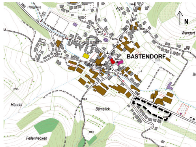
Illustration 1 : plan de situation (base : carte topographique ACT)