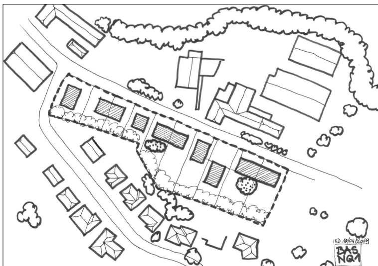
Illustration 4: Esquisse d'aménagement possible

L'esquisse constitue un exemple et est renseignée uniquement à titre indicatif.