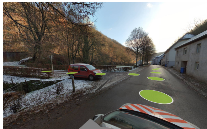
Vue du site depuis la Henneschtgaass vers le sud

Illustrations 4 : photos du site