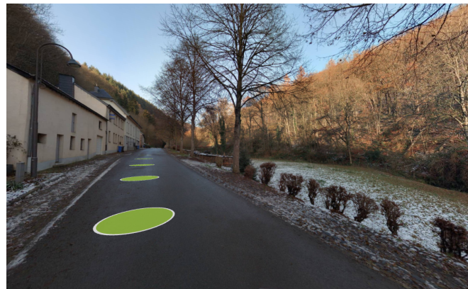
Vue du site depuis la Henneschtgaass vers le nord