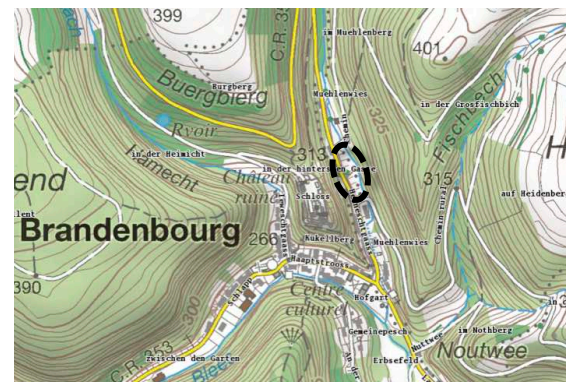
Illustration 1 : plan de situation (base : carte topographique ACT)