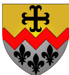
Commune de Bettendorf