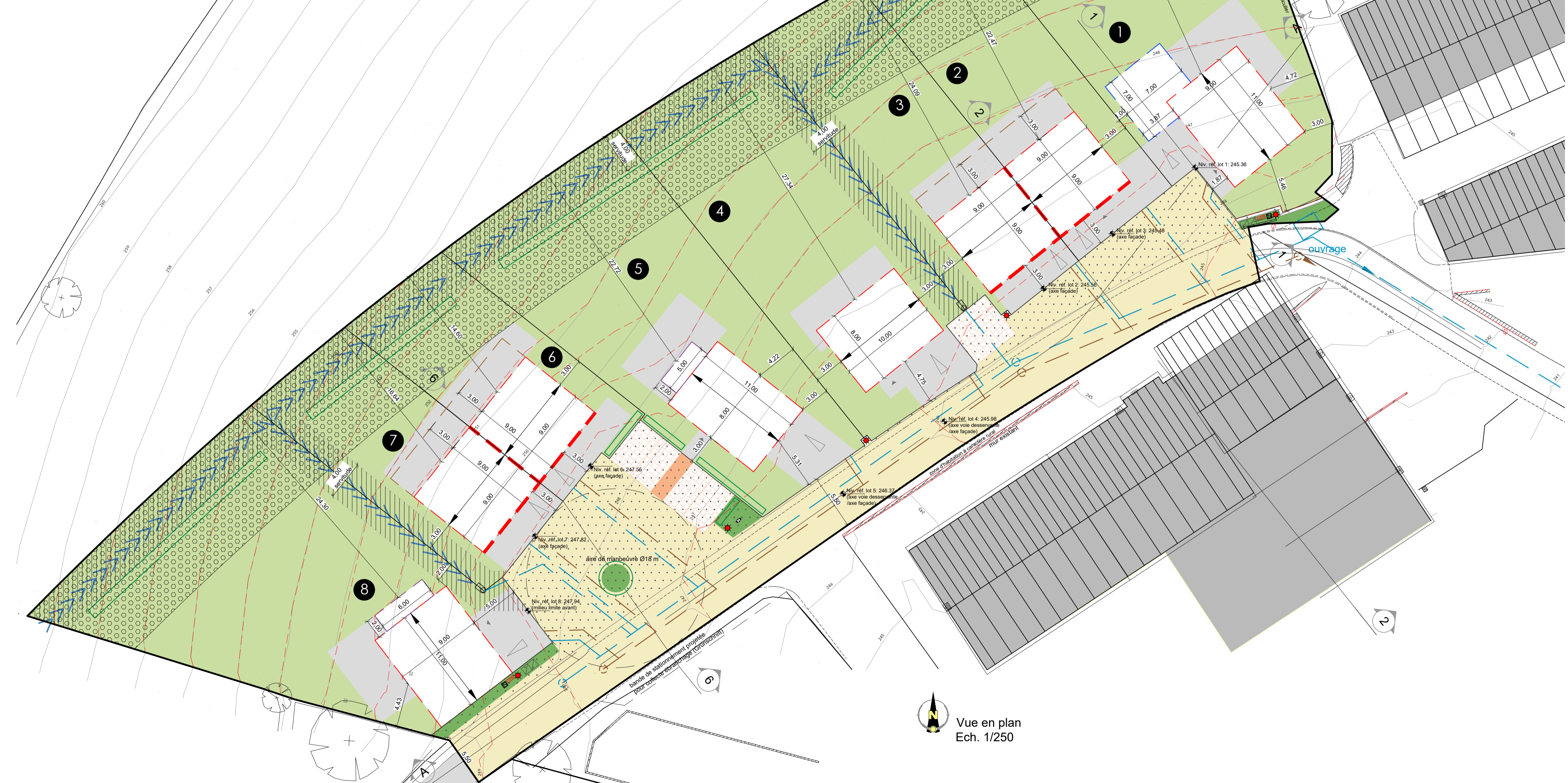
Vue en plan Ech. 1/250